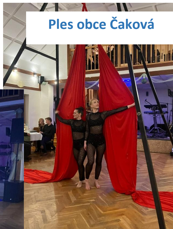
Ples obce Čaková