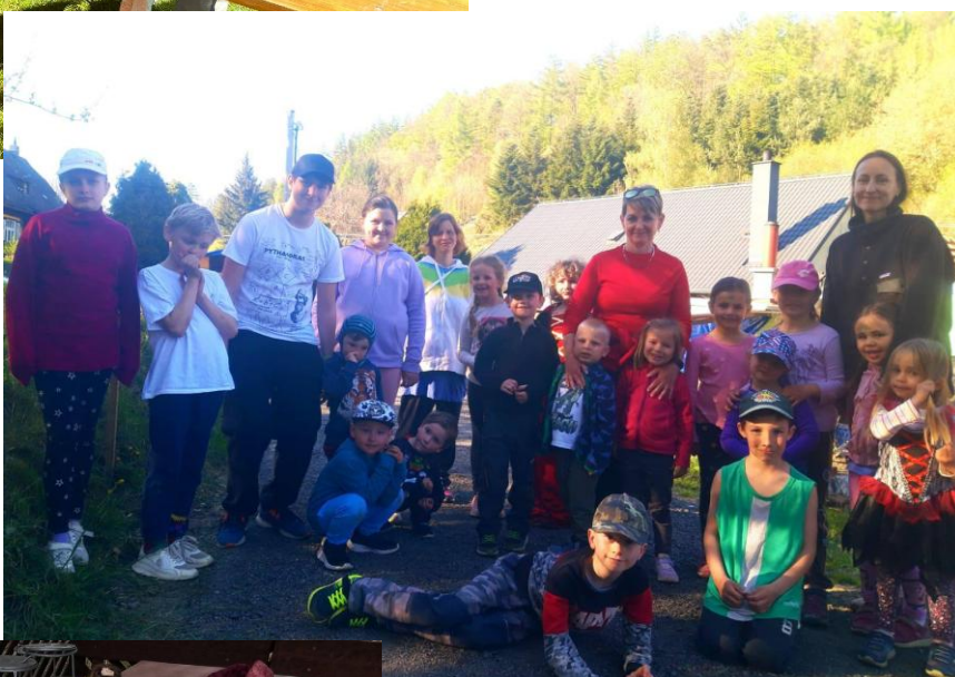
Stavění máje 2026