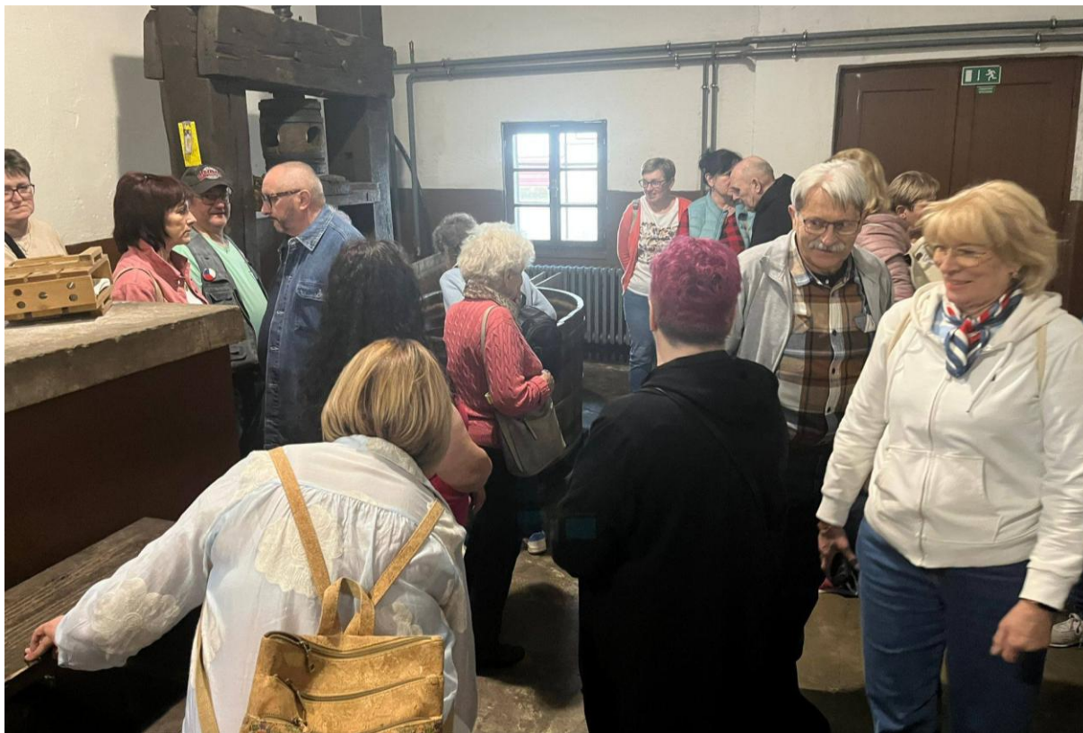
Výlet do Velkých Losin