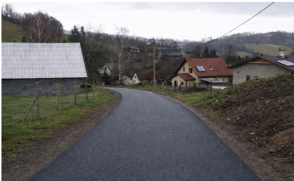
Vizualizace budoucí podoby komunikace

V minulém roce obec podala žádost o dotaci z programu Moravskoslezského kraje na rekonstrukci místní komunikace směrem ke sběrnému dvoru. Žádost tentokrát podporu nezískala, přesto se obec rozhodla opravu realizovat z vlastních prostředků. Na květnovém zasedání zastupitelstva byl schválen výsledek výběrového řízení na akci „ Oprava místní komunikace v obci Čaková “. Jako ekonomicky nejvýhodnější byla vybrána společnost Kareta s.r.o., která nabídla cenu 814 824 Kč bez DPH, tedy 985 937 Kč včetně DPH . Oprava se bude týkat komunikace směrem ke sběrnému dvoru, jejíž stav byl v posledních letech dlouhodobě nevyhovující. Realizace stavby by měla proběhnout v průběhu června 2026.