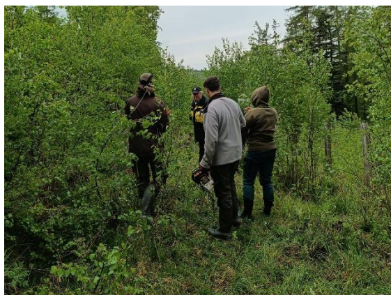
Myslivecký spolek Čaková

Velké poděkování patří všem členům mysliveckého spolku, kteří se pravidelně podílejí na péči o obecní lesy a jejich údržbě.