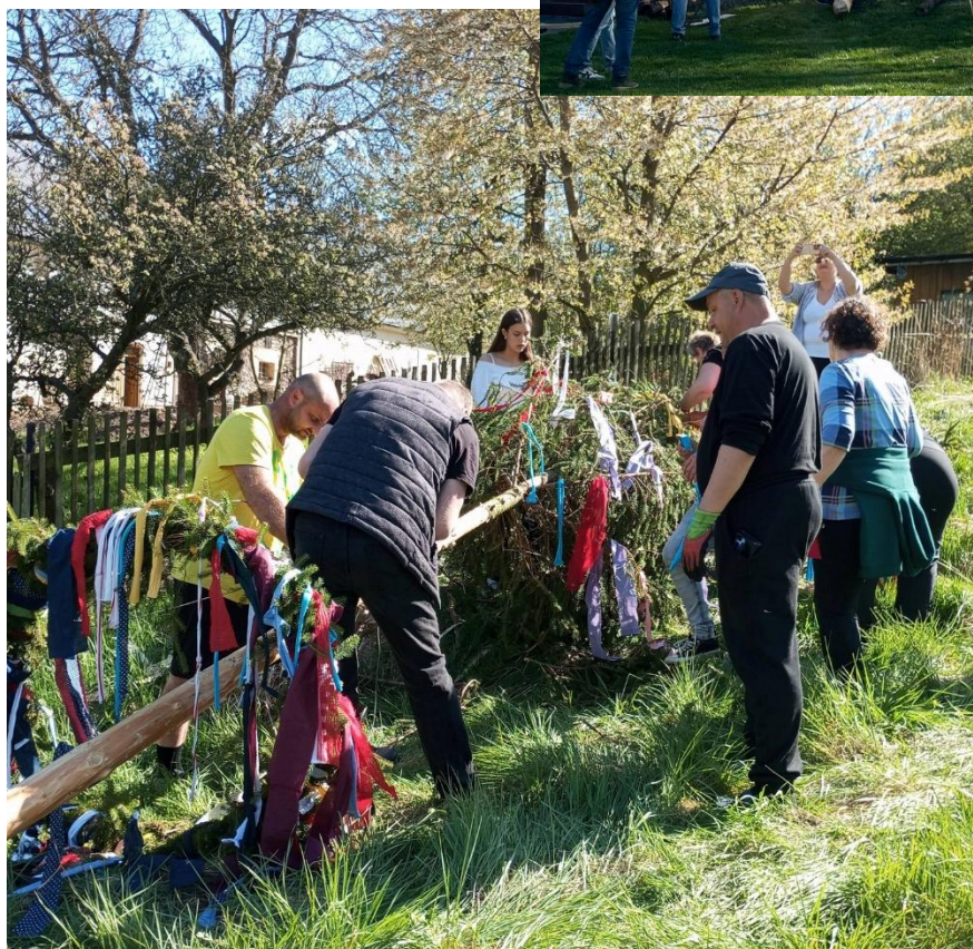
Stavění máje 2026