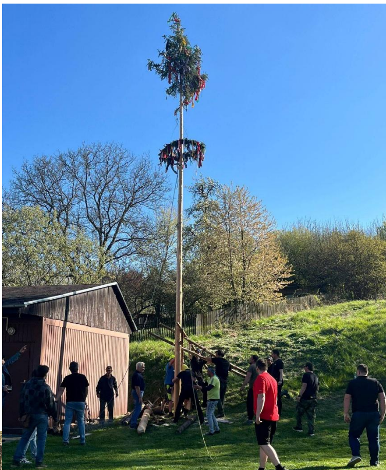
Stavění máje 2026