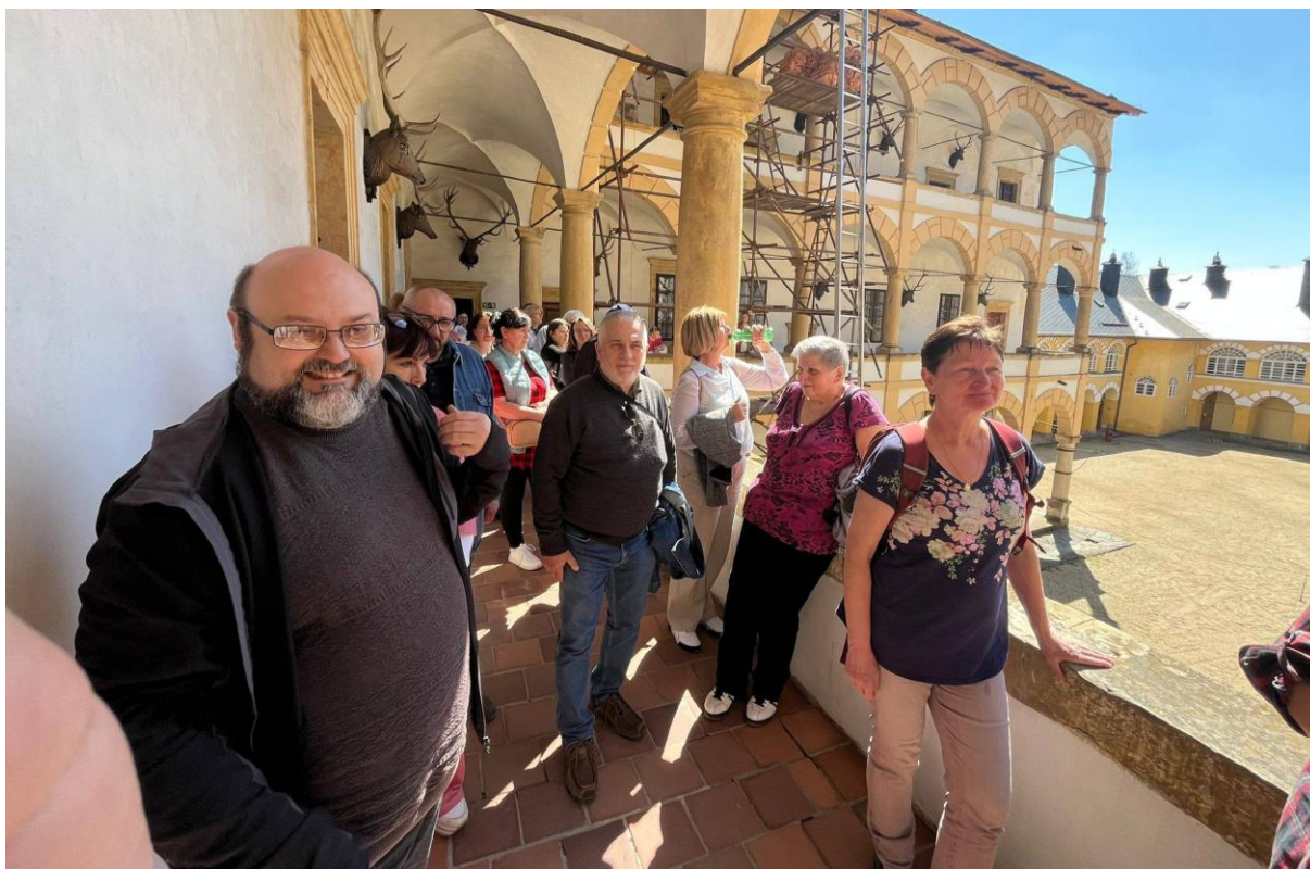
Výlet do Velkých Losin