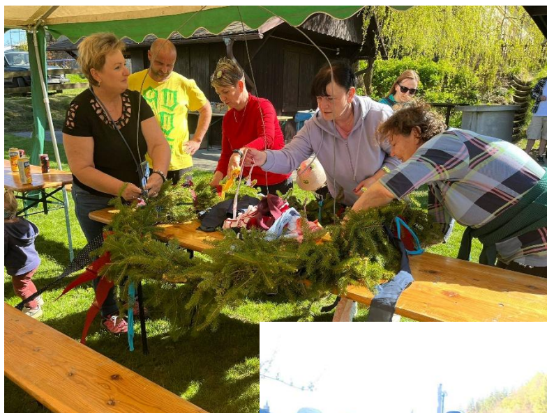
Stavění máje 2026